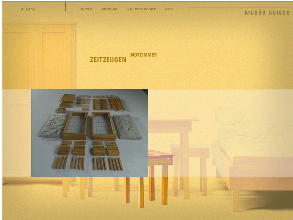
Fig. 3: VIRTUAL TRANSFER, Witnesses: The Notzimmer of Mauritius Ehrlich, trick film No. 1

This last module witnesses is structured into three parts and give reports by historic, fictive and living eyewitnesses: