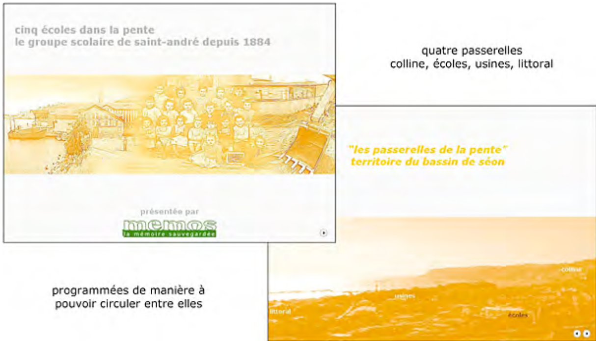
Fig. 1: La base de données « la Pente ». □Mémós, Marseille, 2004.